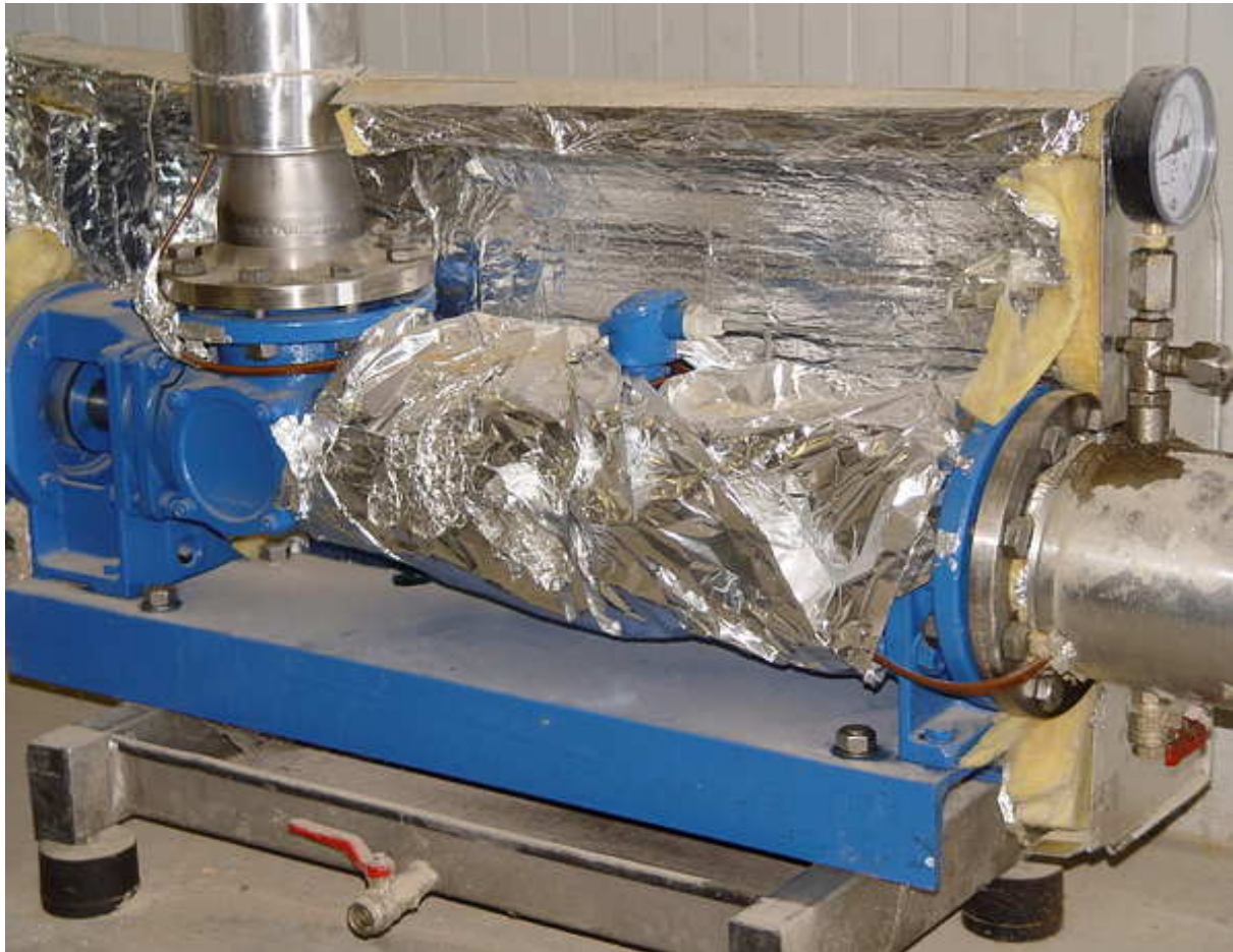
Allweiler-Exzentrerschneckenpumpe der Baureihe AEB1E380; Medium: Fett; Menge: 12.000 kg/h; Druck: 2 bar; Temperatur: 30 - 65 °C; Strecke: 65 m