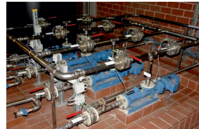
Allweiler®-Exzentrerschneckenpumpen der Baureihe AEB dosieren die Flockungshilfsmittel.

Mit ALLDUR®-Stator (blaue Linien) haben sich die Förderleistungen über etwa 10.000 Betriebsstunden nur geringfügig um etwa 5 bis 10 Prozent verringert und zeigen einen flachen Abfall der Förderkennwerte. Pumpen mit herkömmlichem Statormaterial (rote Linien) zeigten einen schnellen und deutlichen Abfall. Gefördert wurde abrasiver Dickschlamm mit ca. 6 Prozent Trockensubstanz, die Fördermenge lag zwischen 5 und 10 m³/h bei einem Förderdruck von 8 bis 12 bar.