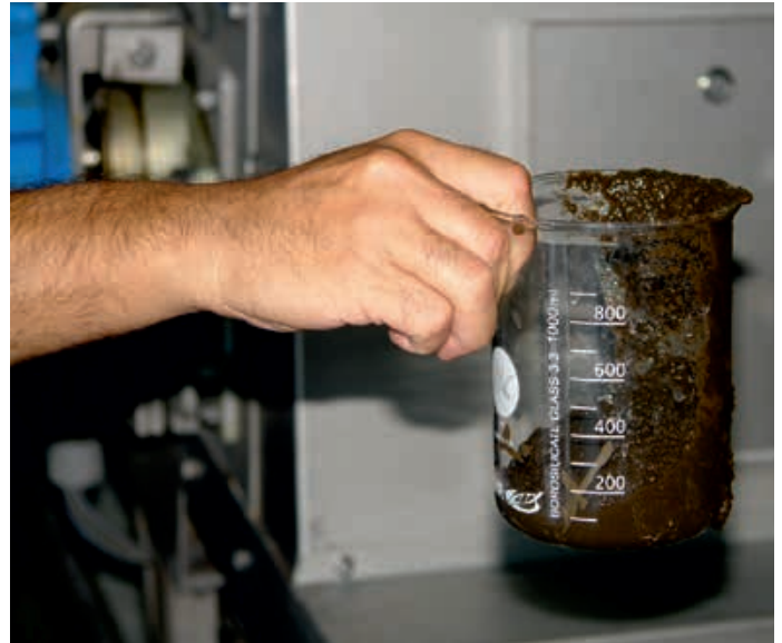
Gefördert wurden mit 8 bis 12 bar 5 bis 10 m 3 /h abrasiver Dickschlamm mit etwa 6 Prozent Trockensubstanzanteil.

Diese Pumpen sind seit Jahrzehnten unter anderem in vielen Kläranlagen im In- und Ausland im Einsatz. Sie zeichnen sich dadurch aus, dass sie auch Medien mit großem Anteil an Trockensubstanz und mit abrasiven Bestandteilen gut fördern. Durch unterschiedliche Ausführungen und Materialien lassen sich die Pumpen gut an die jeweiligen Medien und Förderbedingungen anpassen. Mit Statoren aus „Alldur®“ arbeiten diese Pumpen noch wirtschaftlicher.