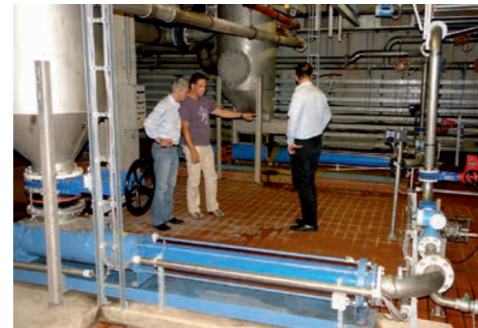
Die Vergleichspumpe der Baureihe „AE4H750“