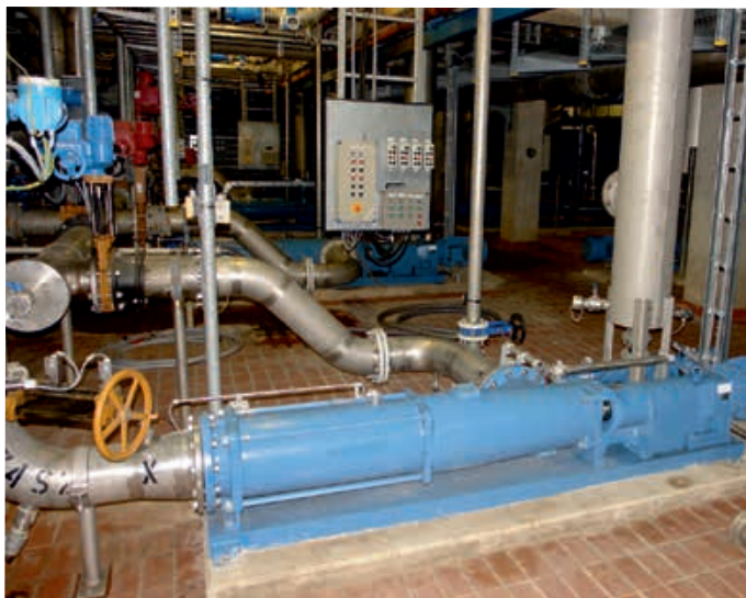
Beschickungspumpen der Baureihe „AE“ für die Siebbänder

CIRCOR bietet unter dem Namen „Alldur®“ einen speziellen Werkstoff für die Statoren der vom Allweiler®-Werk in Bottrop hergestellten Exzentrerschneckenpumpen an.