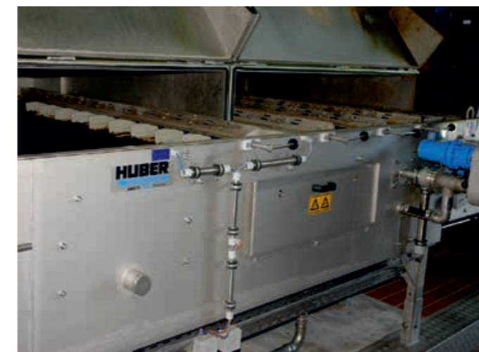
Der Überschussschlamm wird durch Siebbänder der Fa. Huber eingedickt.

Der neue Stator ist zudem besonders elastisch und zugfest, besitzt einen sehr hohen Weiterreißwiderstand und ist über einen großen Temperaturbereich einsetzbar. „Alldur®“-Statoren sind ab sofort für alle Exzentrerschneckenpumpen des Herstellers lieferbar und nachrüstbar.